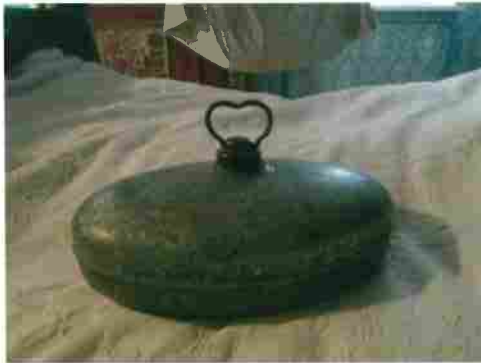
Abb. 2 Eine Zinkwärmflasche, wie sie die Maich verwendet hat (Museum Hummelstube).

Die Kinna senn scho längst ins Bett, alle schlofen in an Raum. Die zwaa Buum in am Bett und aa die zwaa Madla müssn sich a Bett daaln. Bevor sa eig'schlofen senn, hamm sa bestimmt noch gebett - wie jeden Oamd: "Himmelsvodderla mach mi fromm, dass i in dein Himml kumm, drumm im Himml is su schee, konn i mit die Engerla geh".