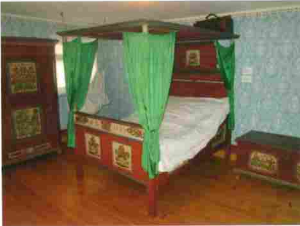
Abb. 1 Das Himmelbett im Museum Hummelstube.