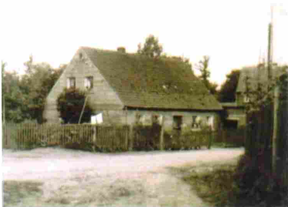
Das ehemalige „Gmaa-Häusla“ in Forkendorf